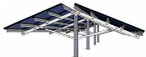
FS Uno-100 东西向安装系列