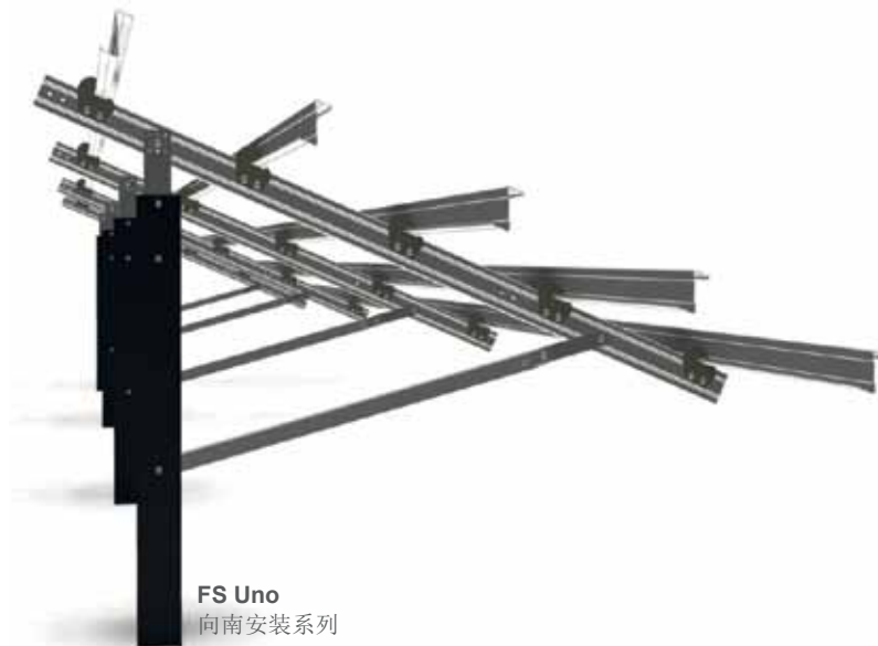
FS Uno 向南安装系列

所获得的经验融入了钢制产品的研发，从而形成了更便宜的太阳能安装支架系统。尤其是地面系统不断增加的成本压力不可避免地导致提高材料利用率的需求。地面系统钢制FS满足了这一要求。